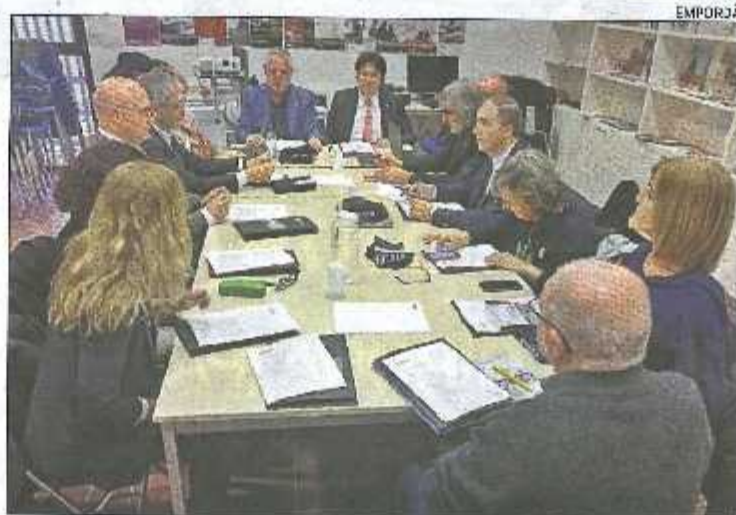
El Consell està presidit pel delegat de la Generalitat a Girona, Pere Vila.

Durant el Consell de Direcció, el delegat també va voler tractar el tema les trobades institucionals amb els alcaldes i les alcaldesses de comarques gironines, coincidint que aquest mes ja ha visitat més de 100 municipis. En aquest cas, apuntava les demandes que els representants municipals li