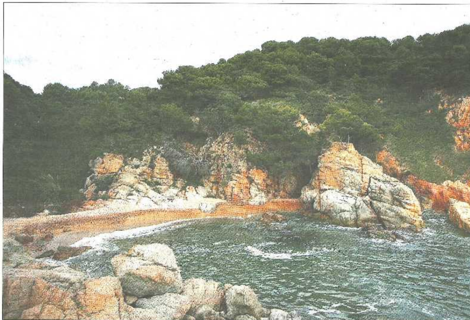
A la Cala Morisca, de Tossa de Mar, no s'hi podran edificar els 122 habitatges que s'hi preveien ■ MARCEL·L·LADÓ