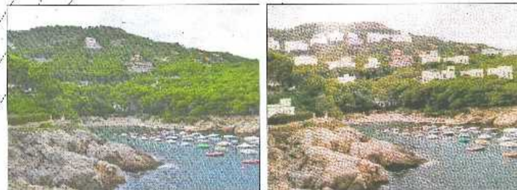
Preservació de la cala d'Aiguafreda a Begur. ► A l'esquerra, imatge actual de la cala d'Aiguafreda, a Begur. A la dreta, fotomuntatge de com hauria quedat si el nou Pla Director no hagués establert la seva preservació.